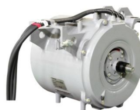
図2 「1000系」用全閉自冷式永久磁石同期電動機