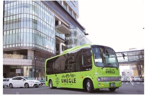
写真は通常のうめぐるバス

※当該ラッピング車両は3台中1台のみとなり、 点検その他の事情により運行されない場合があります。 あらかじめご容赦ください。