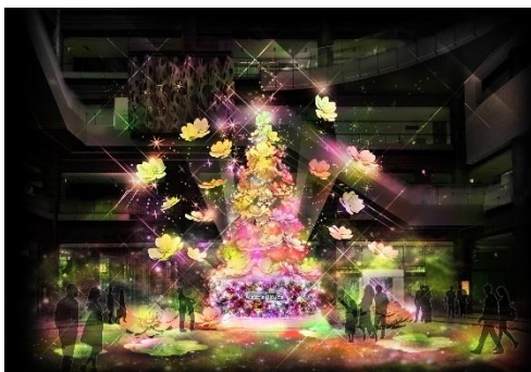
▲ 上) 通常時 下) ライトアップショー時 北館1Fナレッジプラザ メインクリスマスツリー「Timeless Blossom」 11月9日(水)に点灯式を開催予定。(別途ご案内予定)