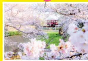
2016年 最優秀賞 写真部門 中西 宏明さんの作品