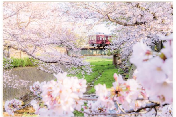
前回の入賞作品の一例

※応募先および応募票、募集要項、応募条件などの詳細につきましては、ホームページ( http://www.hankyu.co.jp/eehagaki/ )や主要駅のラックにチラシを置いてご案内する予定です。