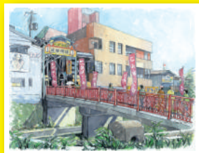
2016年 最優秀賞 絵画部門 長坂 富雄さんの作品