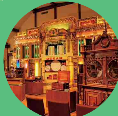
ROKKO 森の音ミュージアム