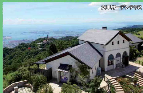
六甲ガーデンテラス