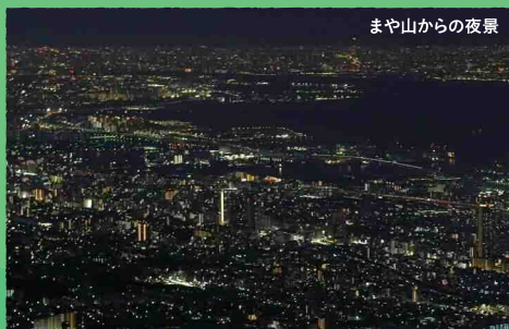
まや山からの夜景