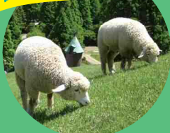
神戸市立 六甲山牧場