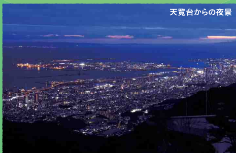
天覧台からの夜景