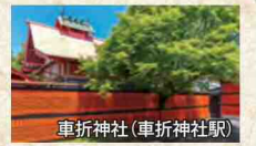
車折神社(車折神社駅)

金運・人気運 など 「多くの芸能人も参拝に訪れる人気スポット」 ★「清めの社」 ご利益ポイント 悪運の浄化や厄災削除のご神力が充実。携帯の待受画像にすると運氣上昇。