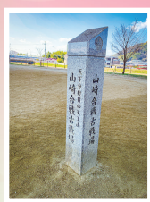
C 山崎合戦古戦場 山崎の戦いにおいて、羽柴秀吉と明智光秀の軍勢が、天王山のふもとに流れていた円明寺川(現在の小泉川)を挟んだこの一帯で激突した。