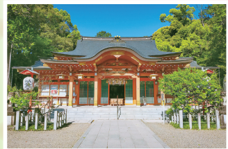
A 長岡天満宮 平安時代に学者・政治家として活躍した菅原道真公が御祭神の神社で、春には梅、キリンマツツジや桜並木、秋には錦帯橋の紅葉が楽しめるなど、風光明媚な神社として知られている。