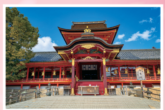
● 石清水八幡宮 八幡造という珍しい構造の本殿を持つ神社で、本殿は国宝に指定されている。厄除け祈願でも知られている。境内には、楠木正成が必勝祈願で奉納した樹齢約700年のクスノキ、日本最大級の石造塔「五輪塔」が建立されている。また、1円玉のモチーフになっている「招置(おがたま)の木」がある。