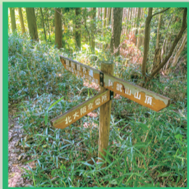
9 道標「北大阪変電所」へ