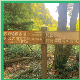
8 道標「北大阪変電所」へ