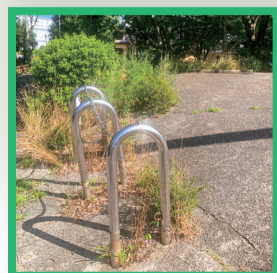
1 西河原公園車止め