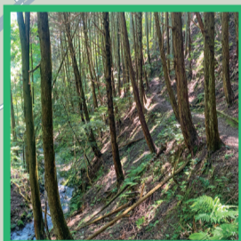
11 林の中を歩く「足元注意」