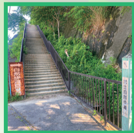
4 武士自然歩道へ階段上がる