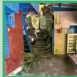
14 商店跡の間の階段を上がる