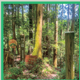
10 道標 東海自然歩道「摂津峡」へ