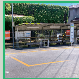
15 上の口バス停(ゴール)