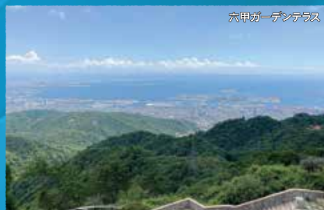
六甲ガーデンテラス