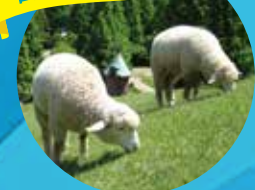
神戸市立 六甲山牧場