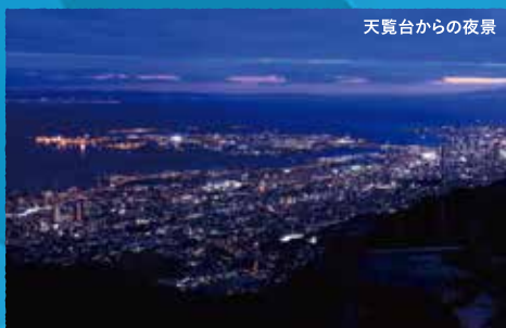
天鏡台からの夜景