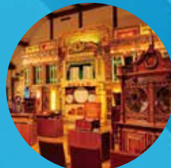
ROKKO 森の音ミュージアム